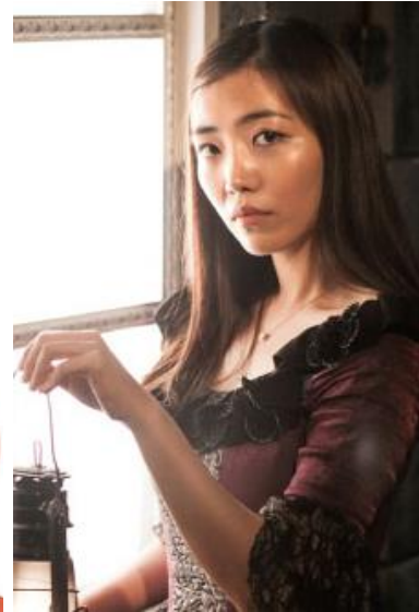
아순와 역 - 강시아